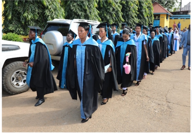
Wahitimu wa Stashahada ya Uuguzi na Ukunga wa Chuo cha ST. Theresa Moshi Kilimanjaro, wakiwa katika maandamano ya kuelekea Kanisani kabla ya kuanza kwa Mahafali