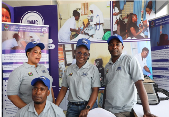
Maafisa kutoka TNMC wakiwa katika Banda la Maonesho ya kitaifa ya Sabasaba yaliyofanyika Jijini Dar es salaam.